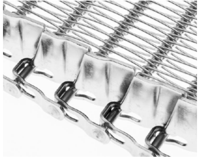
MACTA con acabado recalcado.